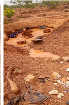
Images1 &2 : Des vendeuses sur un site minier à Tengrela